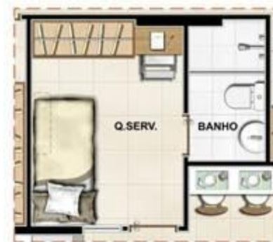
OPÇÃO QUARTO DE SERVIÇO