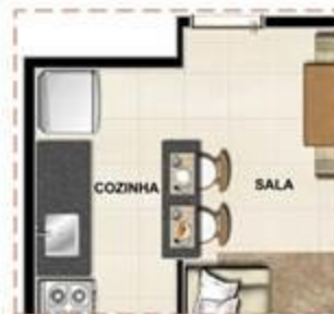
OPÇÃO COZINHA AMERICANA