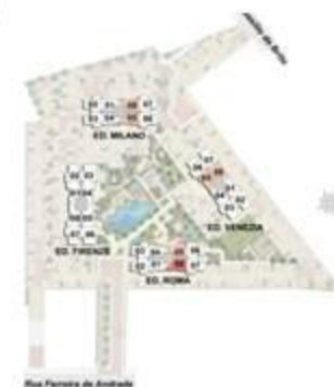
Rua Ferreira de Araújo