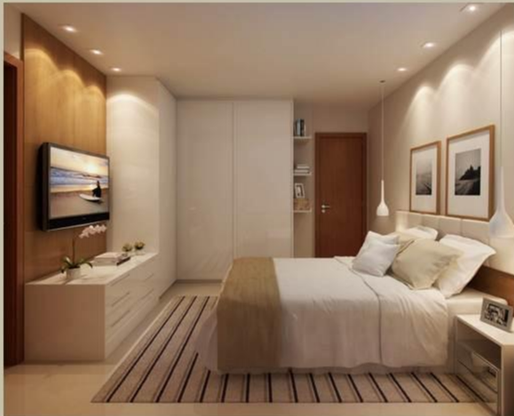
Imagem da suíte Colunas 08 e 05 do Ed. Firenze