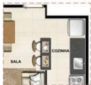
OPÇÃO COZINHA AMERICANA