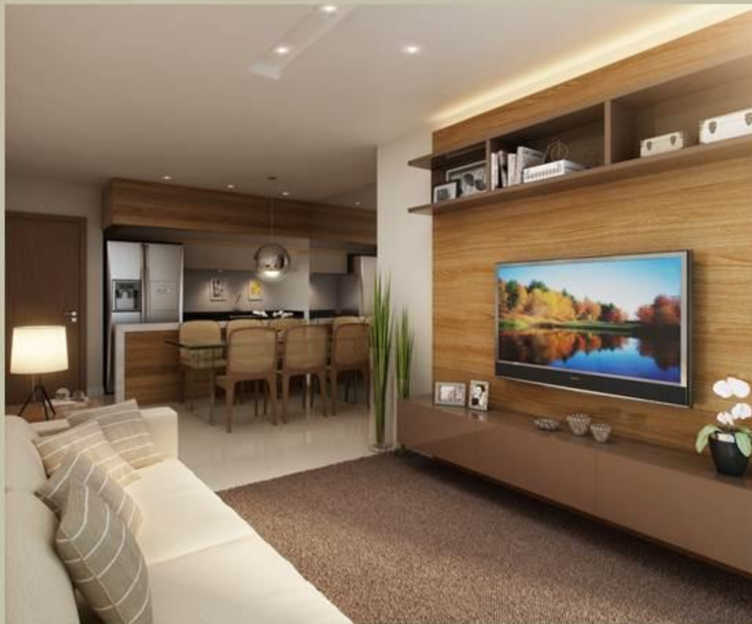
Imagem da sala com cozinha americana. Colunas 02 e 07 do edifício Firenze e 02,03,06 e 07 dos edifícios Roma, Venezia e Milano